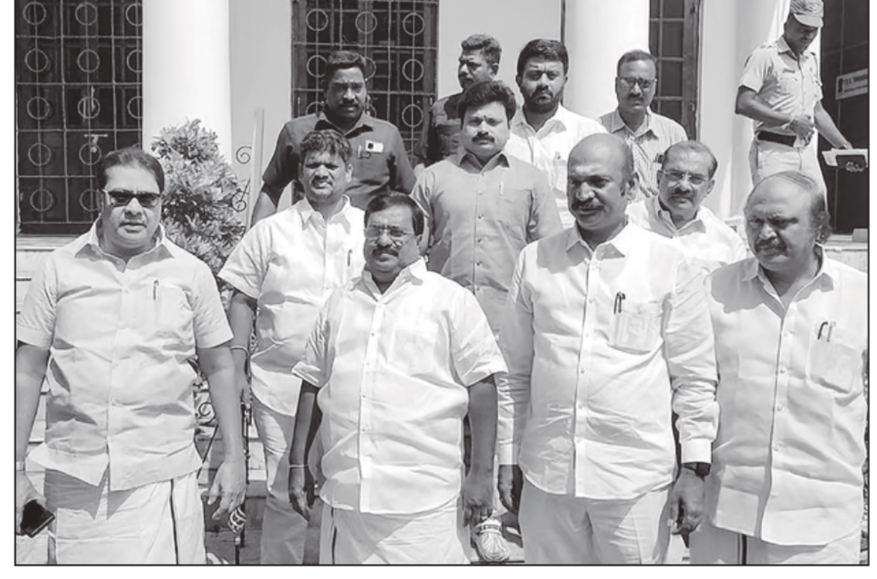
INDIA alliance members walkout of the Puducherry Legislative Assembly after their demand for 50 per cent reservation in private medical colleges for Puducherry students were not met, in Pondicherry on Thursday.

Its legacy continues to be celebrated with enthusiasm by Railway officials, rail fans and passengers, the release said.